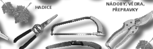
ZAHADNICKÉ NŮŽKY, NOŽE, PILKY