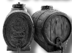
PLASTOVÉ PARAFINOVANÉ SUDY