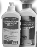
ČISTIČE NEREZ SUDŮ PARAFÍNOVÉ OLEJE