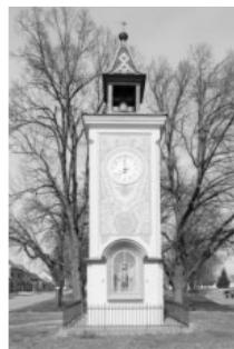
Rekonstrukce zvonice Uherský Ostroh