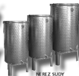
NEREZ SUDY S PLOVOUCÍM VÍKEM